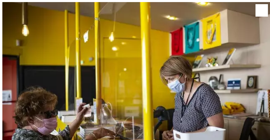
Au Katorza, à Nantes, la direction a choisi d'appliquer une jauge de 49 spectateurs par séance.

Depuis l'entrée en vigueur du pass sanitaire dans les cinémas, mercredi, des exploitants ont choisi de se limiter à 49 spectateurs par séance pour contourner la mesure. D'abord jugée irrégulière, cette pratique a finalement eu le feu vert du ministère de la Santé.