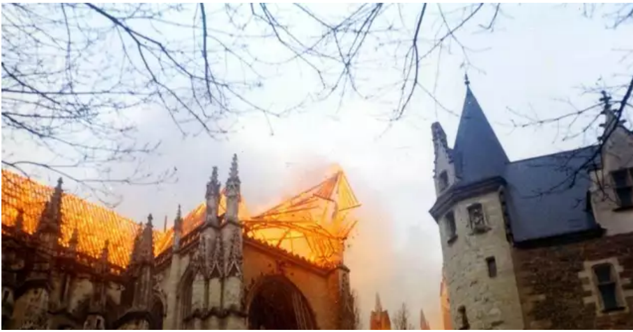
L'incendie a fait de gros dégâts.