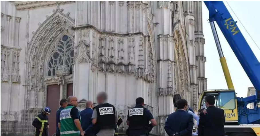
Emmanuel A., bénévole à la cathédrale, est placé en garde à vue. Il passera aux aveux devant le juge le 26 juillet.

Emmanuel A, bénévole à la cathédrale est placé une première fois en garde à vue. Il conteste d'abord toute implication dans les faits. Réinterrogé par les enquêteurs le 25 juillet, il passera aux aveux devant le juge le lendemain, soit le 26 juillet.