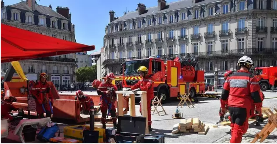
Au plus fort de l'intervention, 120 pompiers seront sur place pour éteindre l'incendie à la cathédrale de Nantes.

De nombreux pompiers sont déjà là. Ils seront 120 au plus fort de l'intervention. Une demi-heure plus tard, les flammes ne sont plus visibles. Les soldats du feu resteront cependant sur place toute la journée. L'orgue monumental de 5 500 tuyaux a brûlé, ainsi qu'un tableau d'Hippolyte Flandrin, mais les flammes n'ont pas endommagé la structure de l'édifice. Le brasier a aussi totalement soufflé la grande verrière de la façade. Le précieux tombeau du duc François II et de Marguerite de Foix, parents d'Anne de Bretagne, considéré comme un chef-d'œuvre de la sculpture française, est intact.