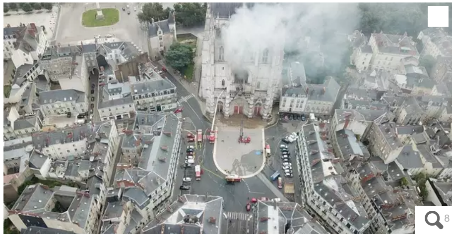
Il y a un an, la cathédrale de Nantes s'embrasait.

Le 18 juillet 2020 à 7h43, les pompiers reçoivent un premier appel. De la fumée s'échappe de la cathédrale Saint-Pierre et Saint-Paul de Nantes. L'édifice s'embrase. Retour sur cette journée où le patrimoine nantais est parti en fumée.