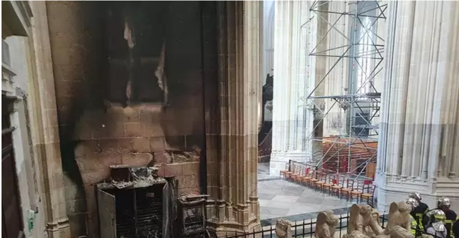
À l'intérieur de la cathédrale, certaines œuvres sont irrécupérables.

«L'État sera là pour une opération qui sera longue, avec le soutien de la Direction régionale des affaires culturelles (Drac)», promet Roselyne Bachelot, ministre de l'Intérieur et de la Culture. «Elle sera là pour diriger les travaux de reconstruction, d'urgence puis des travaux majeurs comme la reconstruction de l'orgue, même si certaines choses sont irrécupérables, comme le tableau d'Hippolyte Flandrin (Saint Clair rendant la vue à un aveugle), complètement détruit». La réouverture de la cathédrale n'est prévue avant 2025.