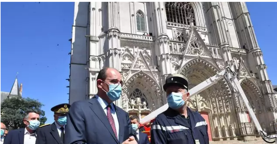
Les Premier ministre Jean Castex arrive à Nantes, sur les lieux de l'incendie, vers 16h.

Le Premier ministre Jean Castex arrive sur les lieux de l'incendie. «Je veux rendre hommage aux forces de sécurité et à la manière dont ils ont géré cet événement», déclare Jean Castex. «Je