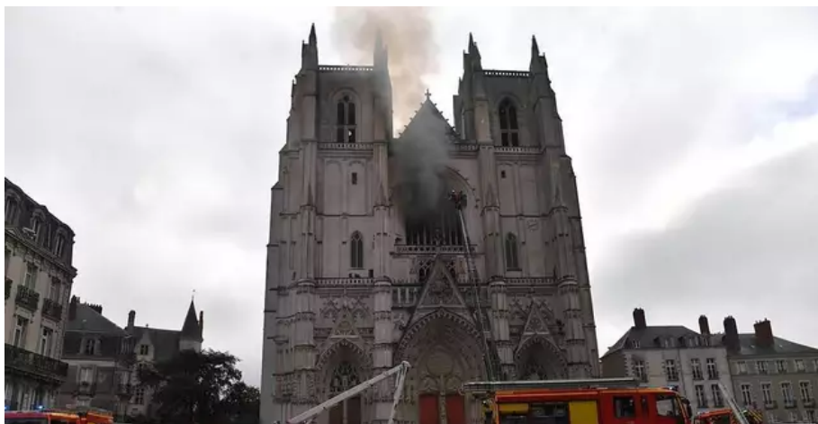
Les pompiers reçoivent un premier appel à 7h43 le 18 juillet 2020.