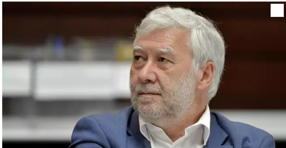
Le sénateur nantais écologiste Ronan Dantec.

La décision d'EDF de renoncer à reconverter la centrale à charbon de Cordemais continue de faire réagir les élus de la région. Ronan Dantec, sénateur de Loire-Atlantique, déplore cette décision.