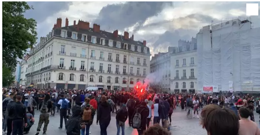
La situation est déjà tendue, place du Bouffay.

Sondage. Déconfinement : appréhendez-vous la fin du télétravail ?