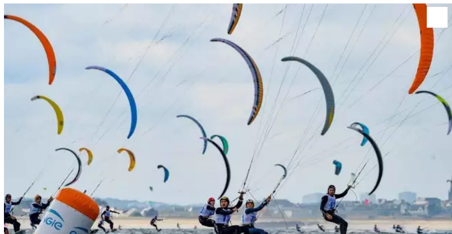
Le spectacle était au rendez-vous.

Le vent a encore été capricieux, hier à Gâvres, pour la dernière journée de la première étape de l'Engie Kite Tour. Mais le bilan est positif.