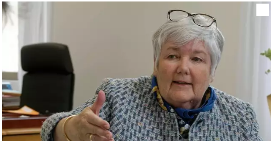
Jacqueline Gourault, ministre de la Cohésion des territoires et des relations avec les collectivités territoriales.