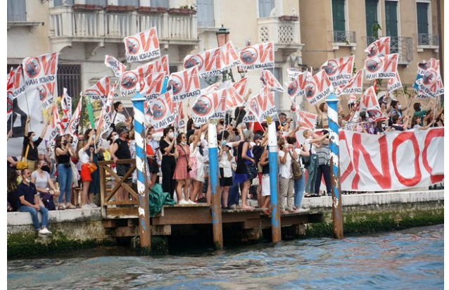
Foule sur les quais de Venise contre les immenses bateaux de croisière, le 5 juin 2021.