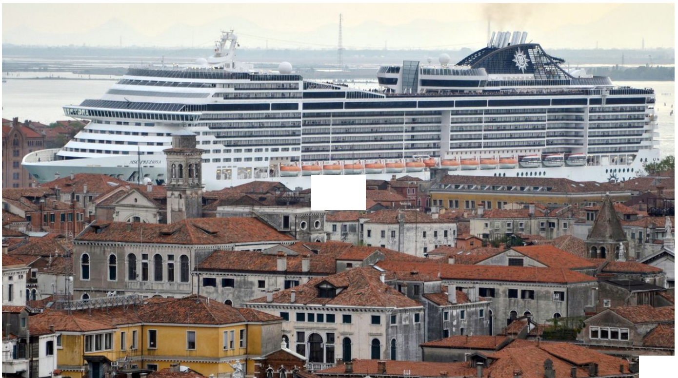
Le tourisme de masse et ses immenses paquebots de retour à Venise / Tout un monde / 6 min. / hier à 08:17