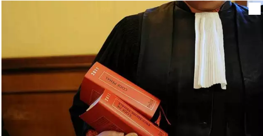
Une femme de Thouaré-sur-Loire était jugée à Nantes ce mardi 25 mai pour des violences à caractère raciste.

Une femme de Thouaré-sur-Loire était jugée à Nantes ce mardi 25 mai pour des violences à caractère raciste.