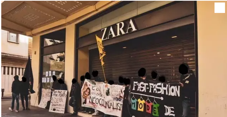
Youth for climate Nantes a mené une opération contre Zara, ce samedi.

Les militants de Youth for climate Nantes ont bloqué la boutique Zara, rue du Calvaire, ce samedi matin 22 mai. Une façon de protester contre la surproduction « et tout ce que représente ce genre d'enseigne ».