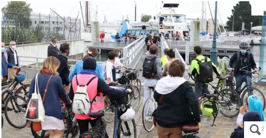
Les vélotafeurs sont de plus en plus nombreux dans le pays de Lorient, comme en atteste ce bouchon à l'heure de la débauche et de l'embarquement sur le transrade.

Avec bientôt 1 000 participants pour sa première édition, l'opération À vélo au boulot fait un tabac à Lorient (Morbihan) auprès des entreprises, collectivités, établissements scolaires... Voici pourquoi.