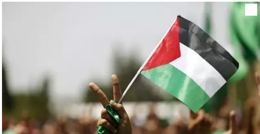
Un rassemblement en soutien au peuple palestinien est prévu jeudi 20 mai 2021 à Lorient, à partir de 18 h.

L'association France Palestine pays de Lorient (Morbihan) appelle un rassemblement de soutien, jeudi 20 mai 2021. Plusieurs autres organisations se joignent à cette initiative.