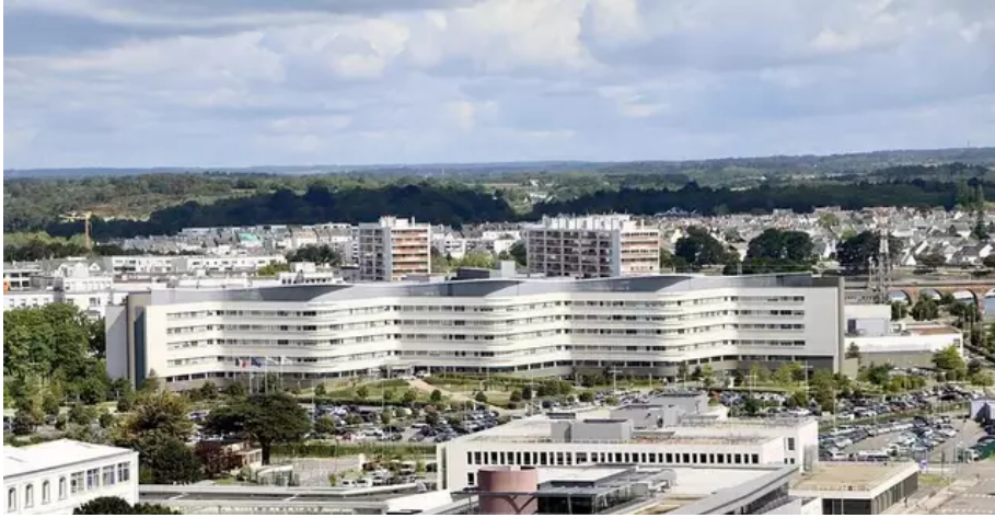
Le parking payant de l'hôpital du Scorff rapporte en moyenne 2 000 € par jour ; cela sert à couvrir la gestion du dispositif (barrières, logiciel, etc.).

Ceci dit, le sujet interpelle les usagers . Le stationnement hospitalier redevenu payant est loin de faire l'unanimité.