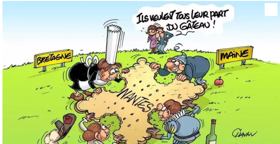
L'appétit pour Nantes vu par notre dessinateur. © Chaunu

Le 2 juin 2014, au sommet de l'État, se joue une valse-hésitation à l'issue de laquelle Pays de la Loire et Bretagne, dont la fusion est en projet, resteront pourtant séparées. Récit d'une journée épique, jalonnée de rebondissements et d'arbitrages présidentiels contradictoires, qui débouche sur deux questions. Que s'est-il tramé dans les coulisses du pouvoir ? Et faut-il remettre sur la table d'idée de cette fusion ?