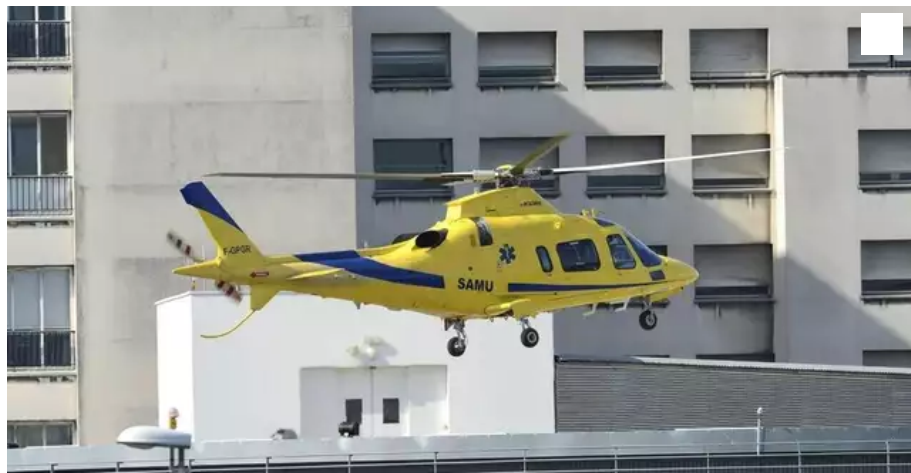
Deux hélicoptères sont mobilisés afin de transférer les victimes au CHU.

Une voiture est sortie de la route et a percuté trois arbres, ce vendredi 16 avril, un peu avant 16 h, au lieu-dit La Garnerie, entre Saint-Lumine-de-Clisson et Saint-Hilaire-de-Clisson, au sud de Nantes. Deux hélicoptères ont été mobilisés afin de transférer les victimes, le conducteur et des passagers, au CHU.