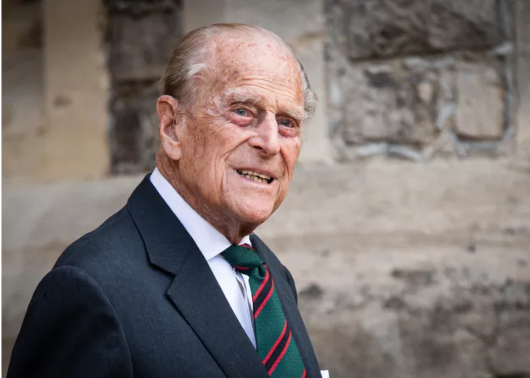
Le prince Philip, époux d'Elizabeth II, est mort à 99 ans.

Le prince Philip s'est éteint ce 9 avril 2021 à l'âge de 99 ans. Celui que la reine Elizabeth II appelait son «roc» aura épousé tous les mouvements d'une famille, d'une nation, et de l'histoire du Royaume-Uni.