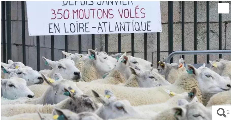
Les éleveurs de moutons dénoncent régulièrement le pillage de leur cheptel.