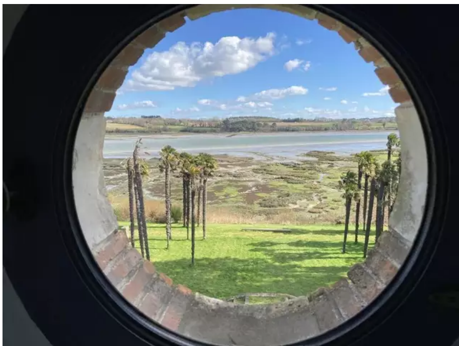
Le domaine du Plessis Kaër, à Crac'h (Morbihan), jouit d'une vue splendide sur la rivière d'Auray.

Le domaine du Plessis Kaër, ce sont plusieurs corps de bâtiments, dont un château du XI e siècle, un manoir anglais du XVIII e siècles, six longères et une vue imprenable sur la rivière d'Auray, avec une façade littorale privée de 3 km.