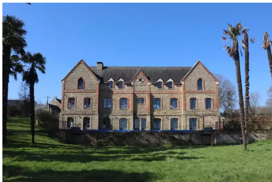
Le domaine du Plessis Kaër, à Crac'h (Morbihan), a de nouveaux propriétaires.

En octobre 2020, le domaine du Plessis Kaër , à Crac'h (Morbihan) , a été vendu aux enchères pour 4,555 millions d'euros . Les nouveaux propriétaires de cet ensemble situé dans un parc de 60 ha en bord de rivière d'Auray – des Bretons – veulent rester discrets. « Ils veulent faire revivre le lieu qui est très beau », assure Fabrice Rassouli, leur représentant.