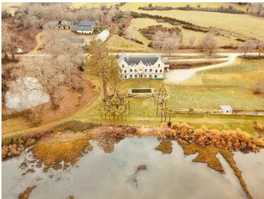
Les nouveaux propriétaires du domaine du Plessis Kaër, à Crac'h (Morbihan), veulent rénover le site pour en faire un lieu éco-responsable.