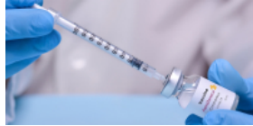
Le vaccin AstraZeneca réservé aux plus de 55 ans