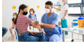
Accélération de la vaccination pour les plus de 70 ans et les enseignants