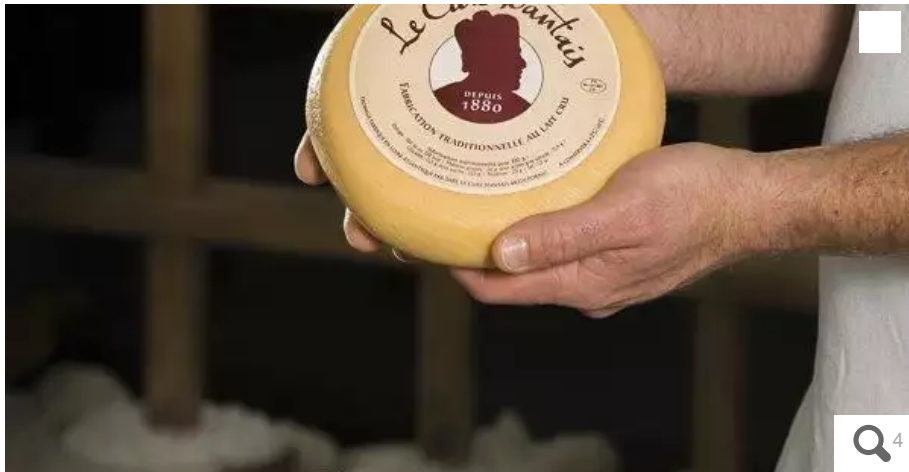
Le fromage le Curé nantais est entièrement fabriqué à Pornic, puis commercialisé en Loire-Atlantique et au marché de Rungis, en région parisienne.

Les pertes se calculent en centaines de milliers d'euros chez le fromager pornicais. Après un printemps désastreux et un été compliqué, il souffre de la fermeture des restaurants.