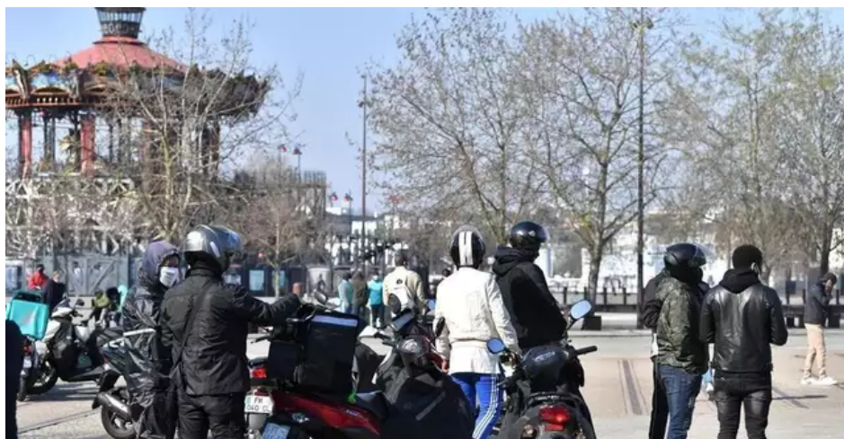
Impossible de livrer à vélo quand les courses sont longues.

Les livreurs ont décidé de se mettre en grève aujourd'hui et de ne pas se connecter aux plateformes qui les rétribuent. Ils demandent un délai à la ville de Nantes pour pouvoir s'équiper et surtout négocier avec les plateformes des moyens pour travailler. Certains imaginent notamment un système de location de scooters électriques. Un livreur confie : « Livrer à vélo est devenu impossible, les courses sont de plus en plus longues. On doit parfois aller jusqu'à Rezé ou Bouguenais pour livrer des repas et il faut les multiplier pour gagner sa vie. »