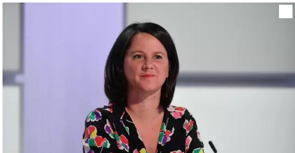
Johanna Rolland, maire de Nantes, sera porte-parole du PS pendant la campagne de l'élection présidentielle 2022.

La maire de Nantes a accepté cette mission, qui la propulsera encore un peu plus dans la lumière sur la scène politique nationale.