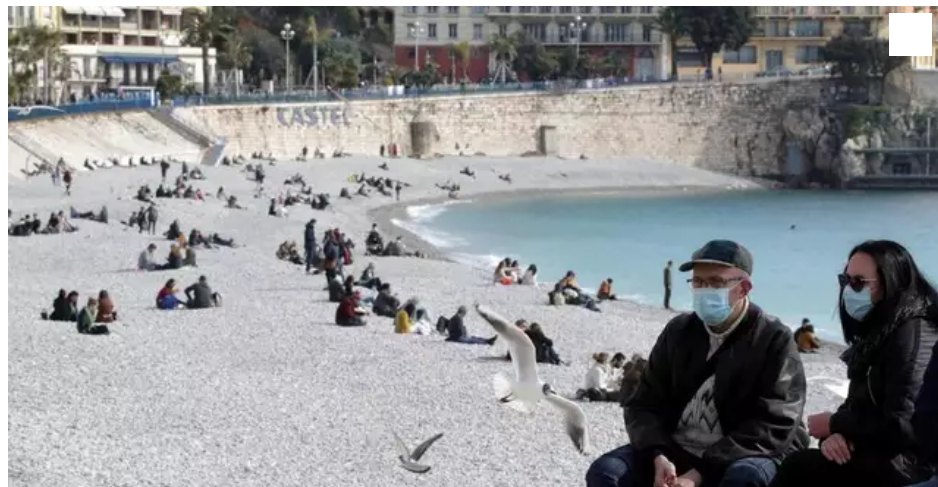
Des personnes masquées le long de la promenade des Anglais à Nice le 18 février 2021.

Alors que la circulation du coronavirus est particulièrement forte dans les Alpes-Maritimes, le préfet du département a annoncé plusieurs mesures dont un confinement le week-end pour la zone urbaine littorale du département.