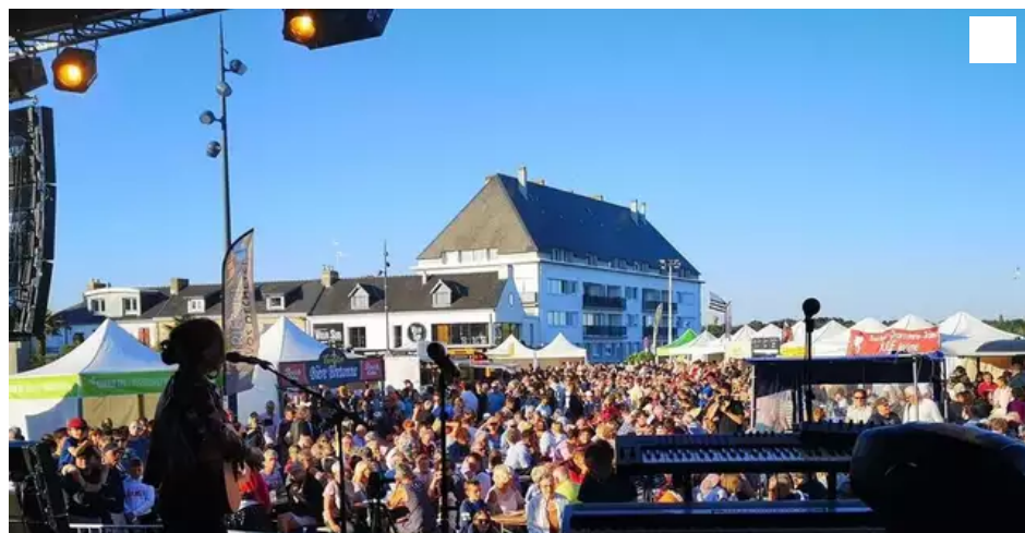
Lors des Jeudis de Plœmeur.

Ronan Loas, maire de Plœmeur (Morbihan), en appelle à des solutions locales pour que, cet été, la culture reprenne ses droits localement, à Plœmeur comme ailleurs. Il invite la ministre de la Culture à venir échanger sur le sujet avec les élus bretons.