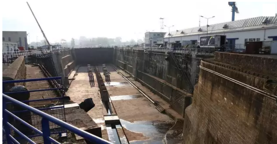
La forme 2 de Naval Group intéresse toujours la navale civile.