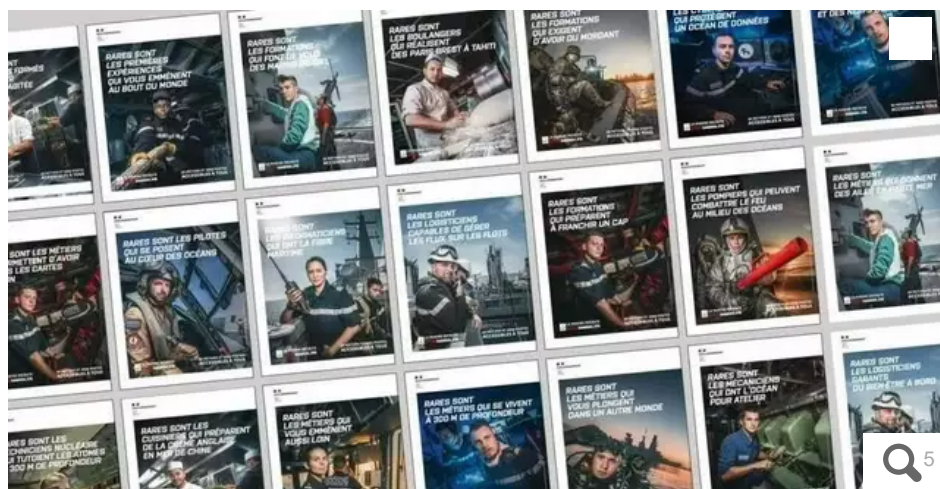
Jeudi 28 janvier 2021, la Marine nationale a dévoilé sa nouvelle campagne de recrutement.

Après ses 3 700 embauches en 2020, la Marine nationale annonce 4 000 nouveaux recrutements en 2021. Pour mieux les séduire, elle se tourne vers les réseaux sociaux et fait appel à une nouvelle agence de communication, TMP Worldwide.