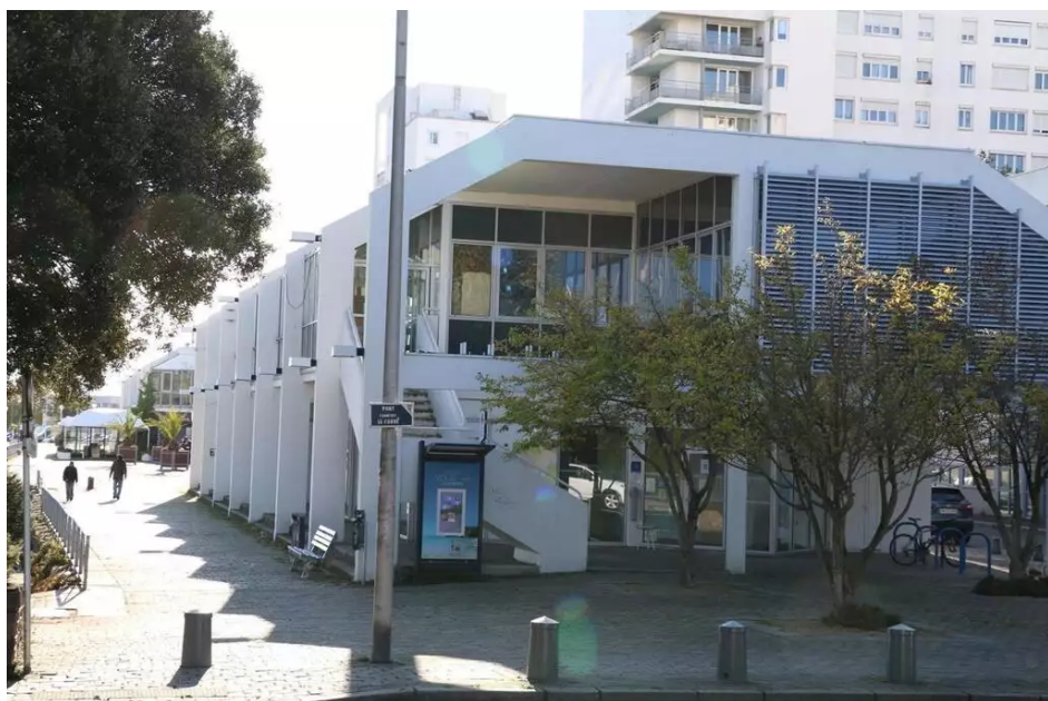
L'ensemble qu'on appelle « galerie de la Maison de la mer », quai de Rohan, sera démolie, une fois l'office de tourisme parti à la gare.

Enfin, autre ensemble emblématique de Lorient qui va disparaître, les ailes de la Maison de la mer . Construit en 1986, en surplomb du bassin de plaisance, quai de Rohan, l'ensemble a mal vieilli. La précédente municipalité avait voté sa démolition . Celle-ci interviendra après le déménagement de l'office de tourisme sur le secteur de la gare de Lorient, prévu avant l'été. L'office est le dernier rescapé. Le bâtiment central de la Maison de la mer a déjà été détruit en 2017, Uship est parti à la BSM, et les restaurants ont baissé le rideau. Il incombera ensuite à la municipalité de décider du devenir du site.