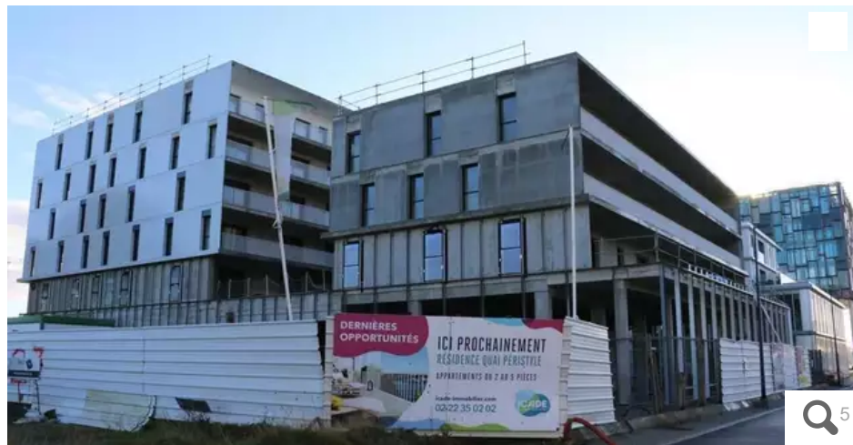
La résidence « Quai Péristyle » sera livrée au premier trimestre 2021, dans un secteur en pleine mutation.

Des grues dans le ciel lorientais mais aussi des bulldozers pour démolir le béton fatigué. Tour d'horizon des grands chantiers qui vont se poursuivre ou démarrer en 2021, changeant le visage de la ville de Lorient.