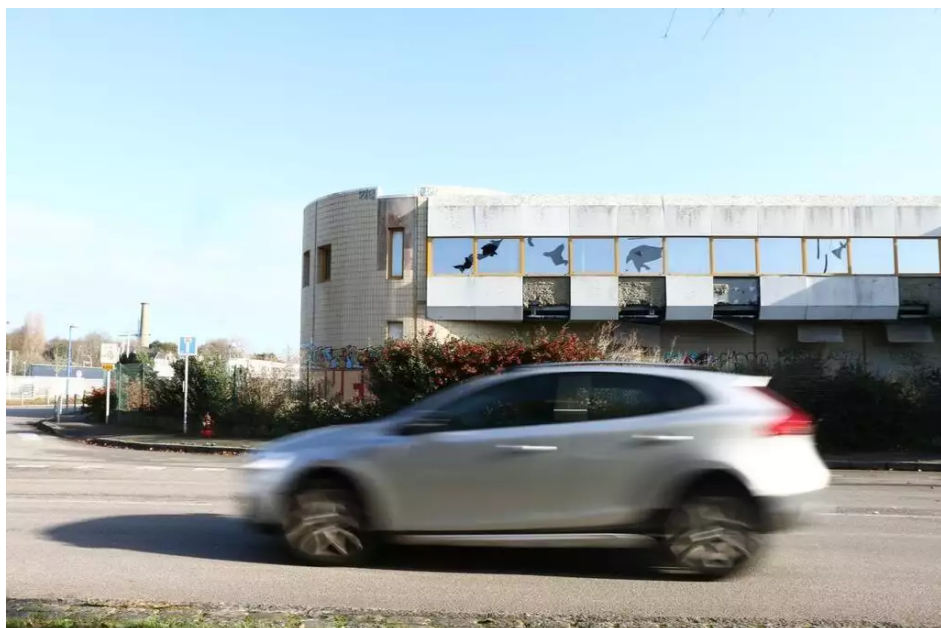
L'ancienne usine Cobral, devenue une verrerie en entrée de ville, sera démolie.

Campé à l'entrée ouest de la ville, à l'angle du boulevard Cosmao-Dumanoir et de la rue Emile-Bourdelle, l' ancien collège de la Retraite va lui aussi être démolie en 2021 pour laisser place à 5 immeubles d'habitation (logements sociaux, accession libre, résidence services senior). Début des travaux prévu en septembre.