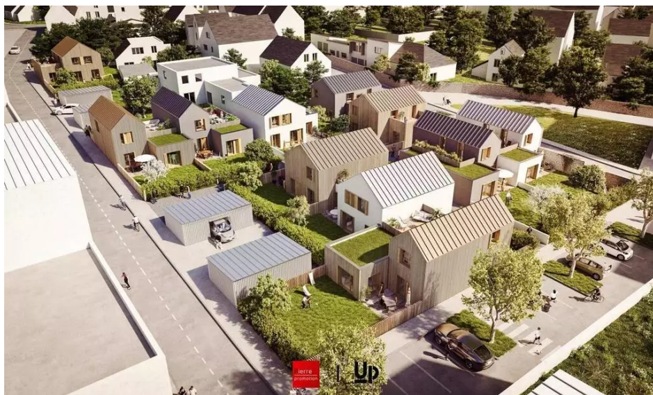
Vue des onze maisons individuelles qui seront construites lors de la phase 1 à Bodélio.

À la pointe du Péristyle, la livraison de la résidence baptisée « Quai Péristyle » (du promoteur Icade) est envisagée au premier trimestre 2021. Face au Scorff, près de la maison de l'agglomération, deux bâtiments neufs sont sortis de terre. Ils comprendront 49 logements, du 2 au 5 pièces, avec services et commerces en rez-de-chaussée. Dans la foulée, Giboire doit démarrer la construction d'un nouvel ensemble de 53 appartements, sur l'îlot 4 C.