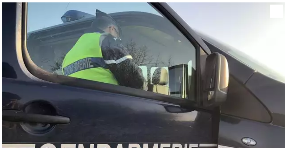
Deux véhicules avec des remorques remplies de matériel volé ont été interceptés par les forces de l'ordre.

Ce dimanche 3 janvier, un peu avant 16 h, deux véhicules avec des remorques remplies de matériel de chantier ont été arrêtés par les policiers de la brigade anticriminalité et les gendarmes, à Sainte-Luce-sur-Loire, près de Nantes.