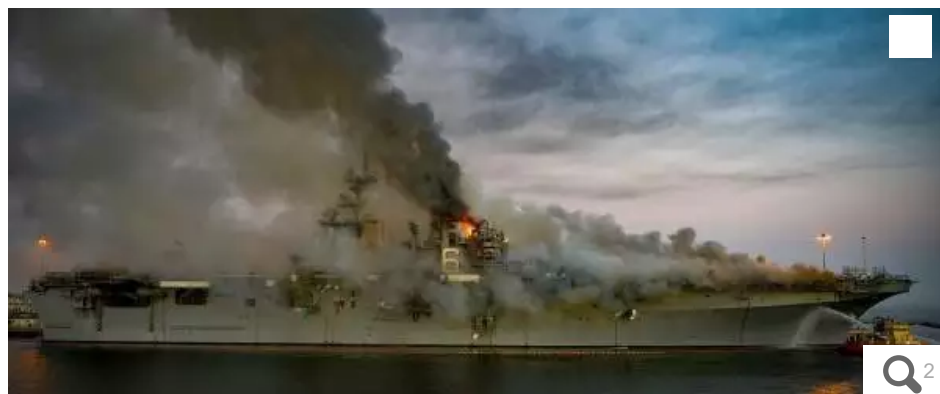
Le Bonhomme-Richard en feu, le 13 juillet à San Diego.

L'« USS Bonhomme Richard » ne reprendra pas la mer. Ce navire amphibie de la classe « Wasp » a été sérieusement endommagé le 13 juillet dernier lors d'un incendie. Il sera déconstruit, ainsi en a décidé la Navy.