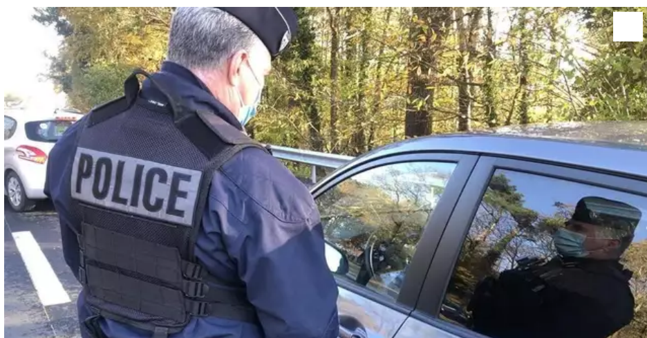
La police reste mobilisée pour vérifier les attestations de déplacement des automobilistes.

Une amende de 135 € sanctionne le défaut de présentation d'une attestation de déplacement. La police qui poursuit ses opérations de contrôle s'est aussi attachée lundi 23 novembre à vérifier la fermeture des rayons de produits « non essentiels » dans les centres commerciaux.