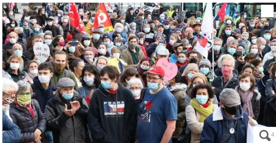
La foule place Aristide-Briant.

Plus de 1 200 personnes de tous âges ont gentiment exprimé leur ferme opposition à la loi dite de sécurité globale, ce samedi à Lorient. Pas d'incident à déplorer.