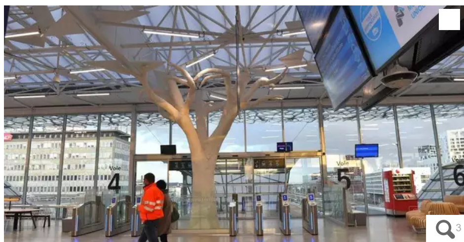
Référence architecturale organique avec les 18 arbres piliers de la mezzanine.

Ouverte au public ce vendredi 20 novembre, la nouvelle gare SNCF, signée par l'architecte Rudy Ricciotti, est en capacité d'accueillir les 25 millions de voyageurs projetés en 2030 contre les 12 millions reçus en 2019.