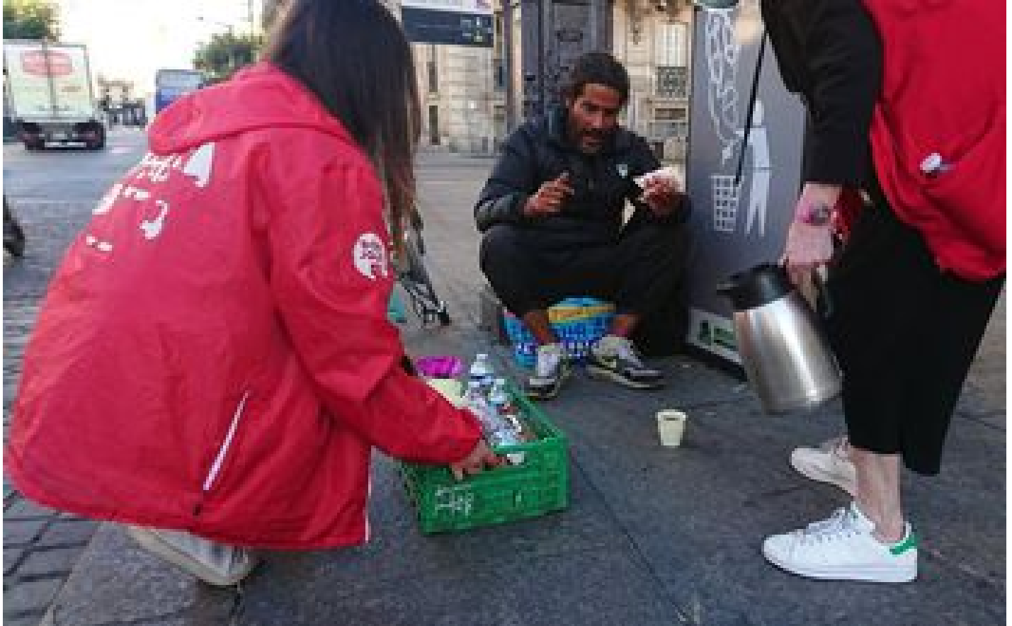
Paris : avec la crise sanitaire, de plus en plus de monde à la rue