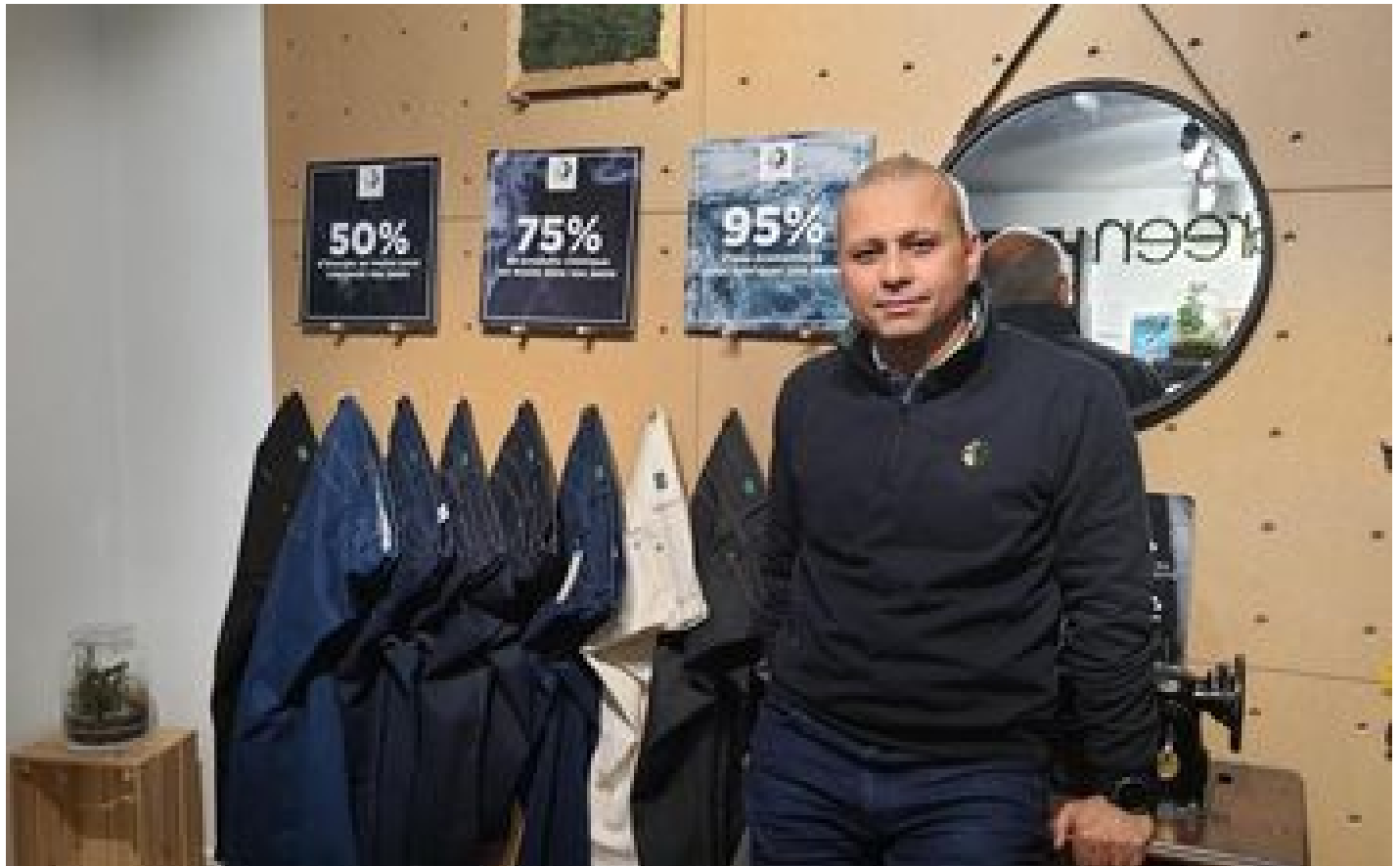
Green Lion, des jeans écoresponsables nés à Joinville