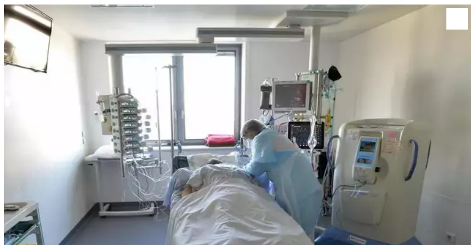
Dans la chambre d'un patient Covid-19 en service de réanimation, à l'hôpital du Scorff à Lorient.

Au sein du Groupe hospitalier Bretagne-Sud (Lorient-Quimperlé), des points de tension sont notamment relevés en gériatrie. Parallèlement, l'établissement recrute infirmiers et aides-soignants.