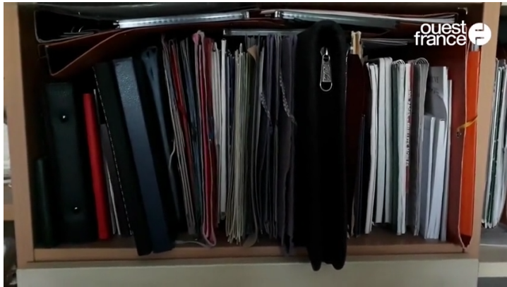
Video Smart Player invented by Digiteka