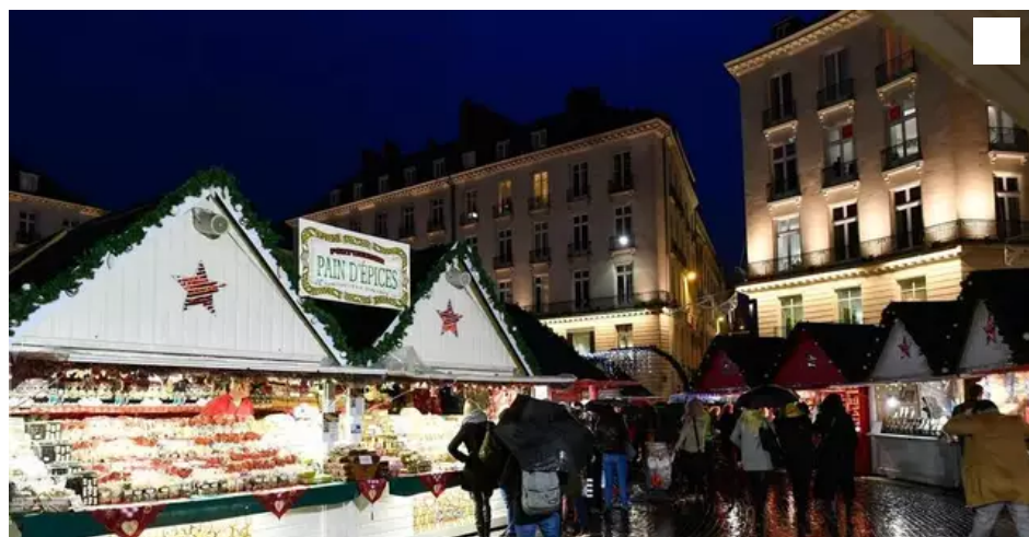
Le marché de Noël n'aura pas lieu.

Trop risqué sur le plan sanitaire, pandémie de Coronavirus oblige, la maire, Johanna Rolland, a décidé d'annuler les festivités de fin d'année. « Un crève-cœur » pour la société Nantaise 2A Organisation dont l'activité de l'année repose entièrement sur les fêtes de fin d'année.