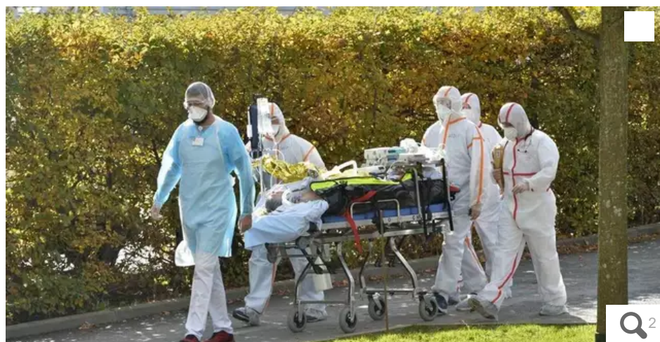
Arrivée de deux malades du Covid 19 en service de réanimation à l'hôpital de Lorient, en provenance d'Avignon.

Le service de réanimation de l'hôpital du Scorff à Lorient (GHBS) a accueilli ce mercredi 4 novembre 2020 deux nouveaux patients Covid +, jusqu'ici hospitalisés au CH d'Avignon.