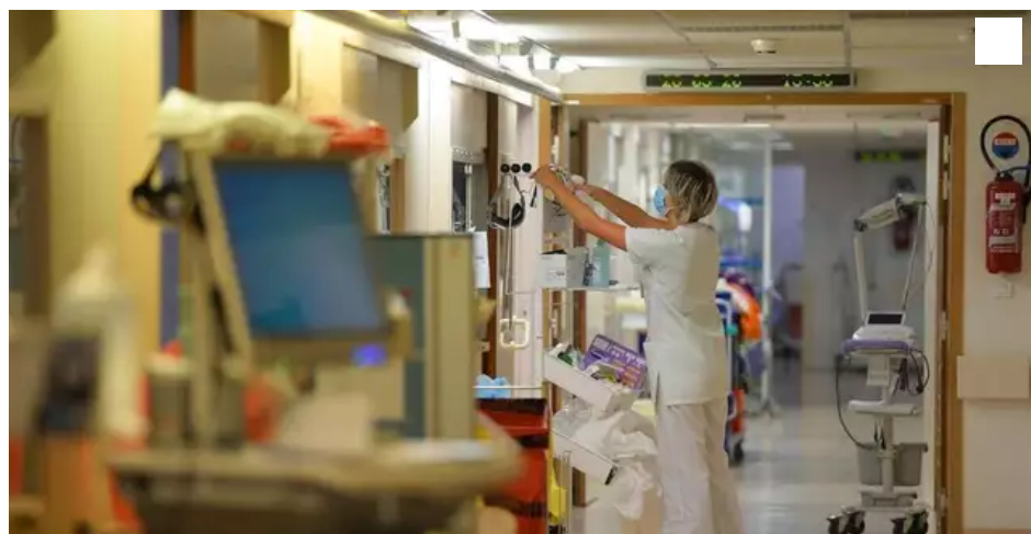
Le service de réanimation du CHU de Nantes avec des patients atteints de Covid-19.

Les capacités d'hospitalisations augmentent, des salles de blocs chirurgicaux ont fermé... Le CHU de Nantes a pris des mesures face l'épidémie. Mais, il manque de soignants.