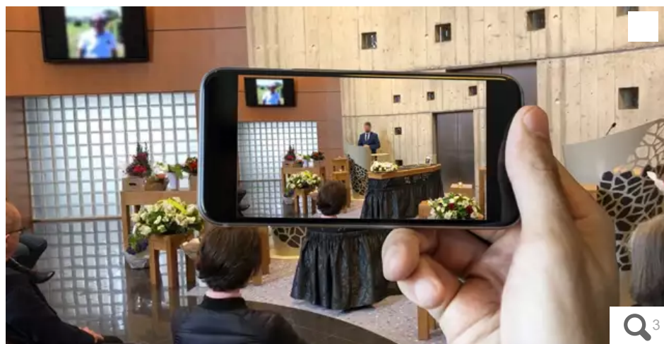
Funérailles en ligne avec "Cérémonie" par Additi, filiale du groupe Ouest France