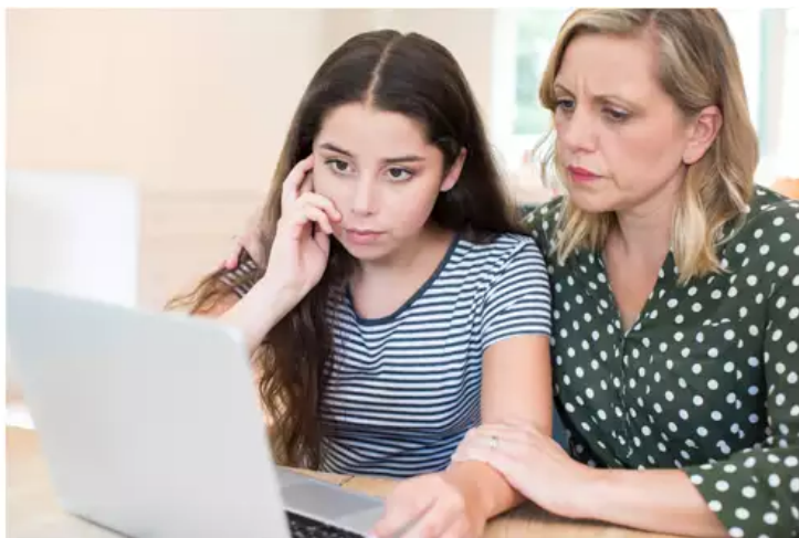
Cérémonie d'obsèques à distance avec "Cérémonie" d'Additi

De même, un accompagnement personnalisé est assuré sept jours sur sept avant, pendant et après la retransmission des obsèques. Une assistance téléphonique continue qui permet de répondre à toutes les questions.