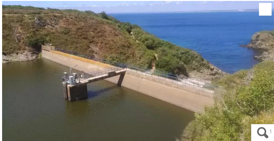
Groix a été placée en « crise sécheresse » en juin 2022.

Faute de précipitations, la préfecture du Morbihan vient de placer, ce vendredi 12 août 2022, l'ensemble du département en état de crise sécheresse, le niveau d'alerte le plus élevé. Les mesures de restrictions d'usage de l'eau potable sont renforcées.